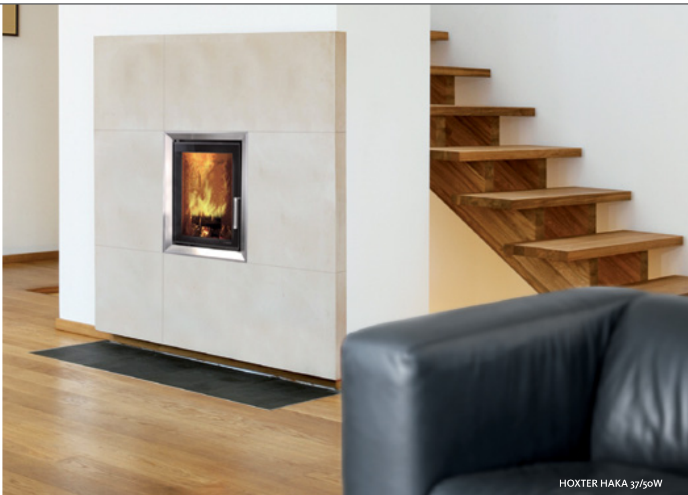
HOXTER HAKA 37/50W