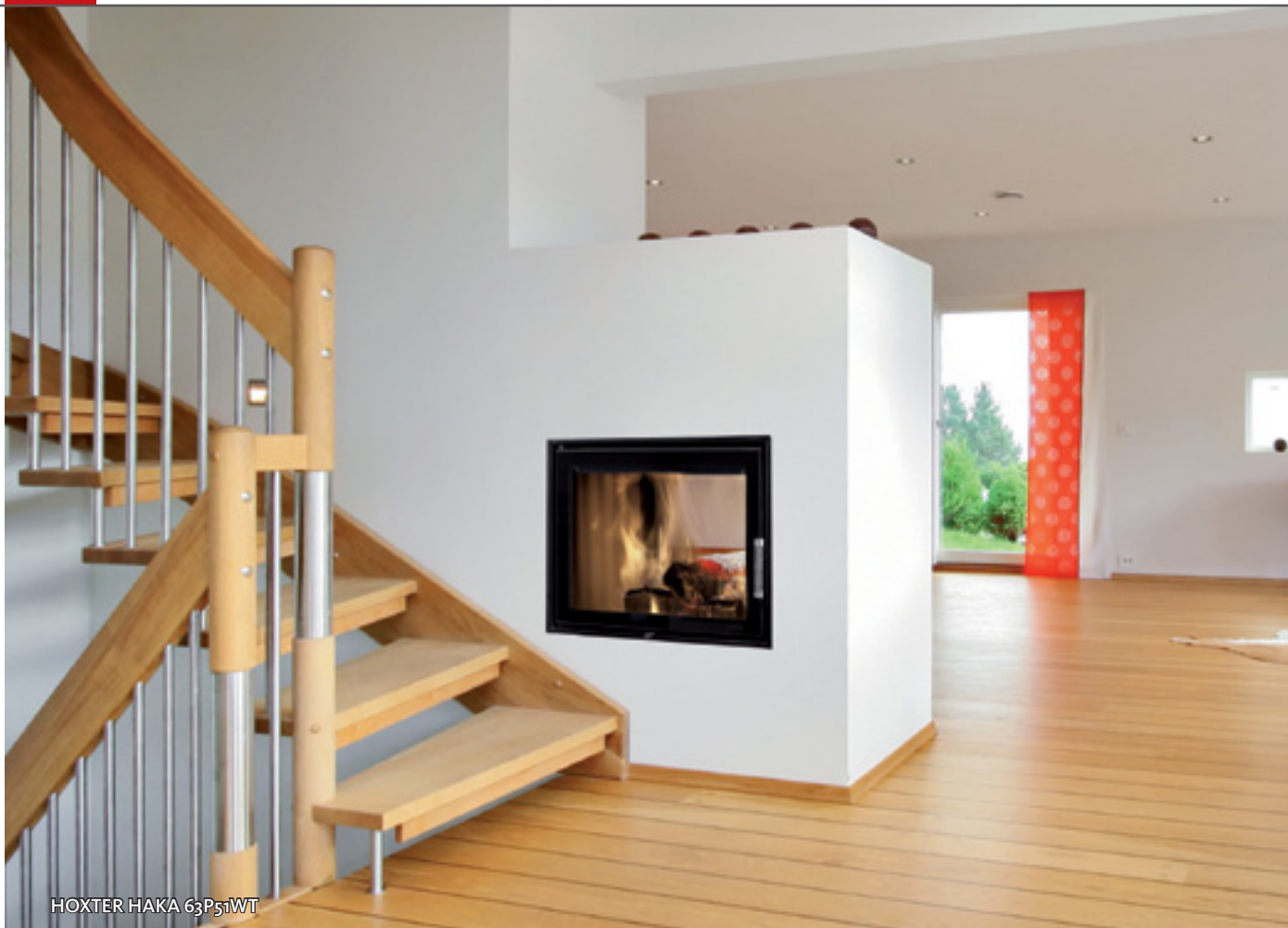
HOXTER HAKA 63P51WT