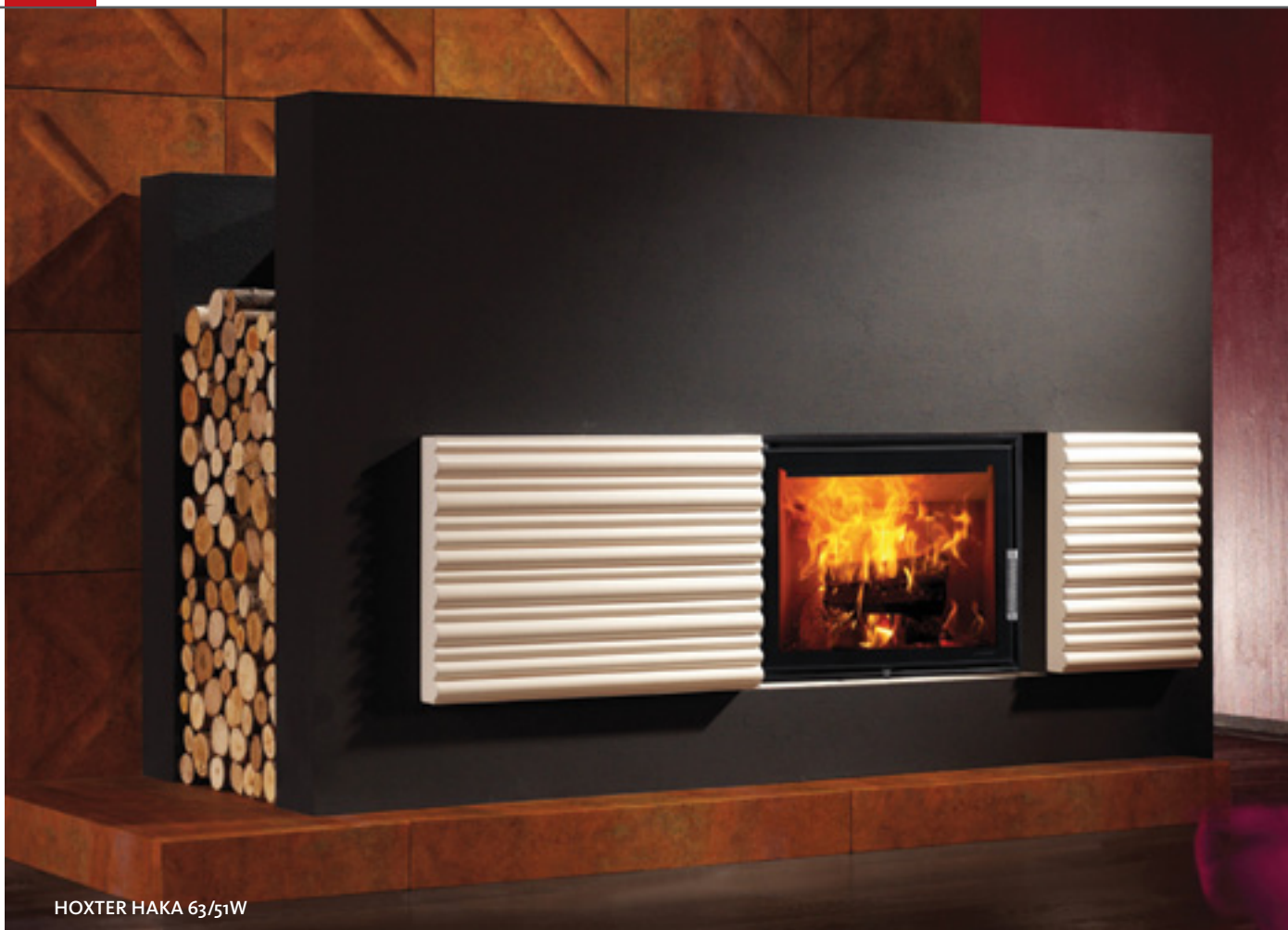
HOXTER HAKA 63/51W