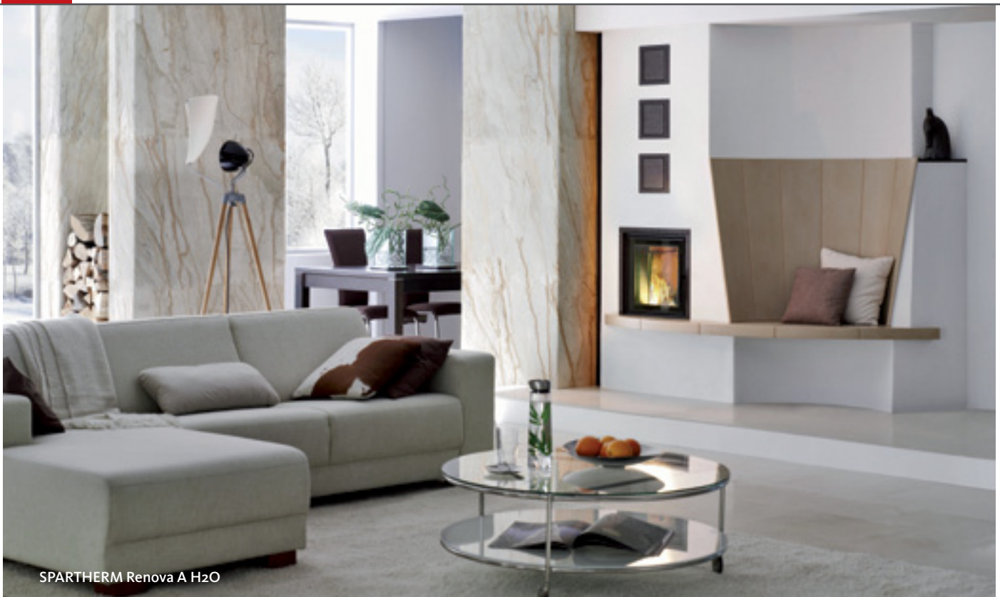
SPARTHERM Renova A H2O