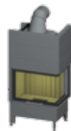
Varia 1Vh H2O - 4S